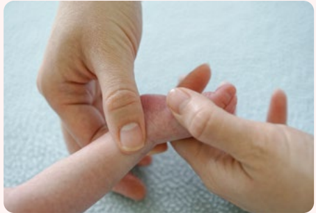
2. oldalirányú boka masszírozása