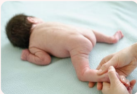
2. vádli körkörös masszírozása