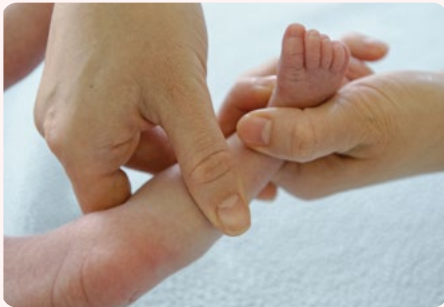
3. lábszár masszírozása