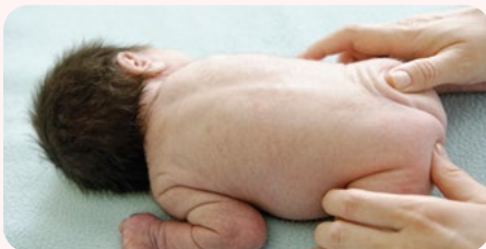
3. körkörös masszírozás