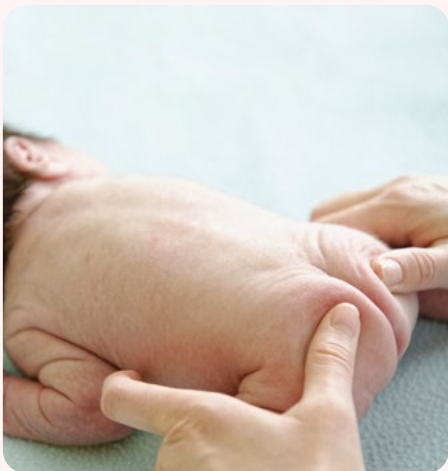
1. hosszirányú masszírozás