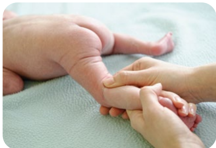
3. krúživé vytieranie zákolennej jamky