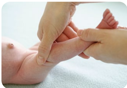
4. krúživé vytieranie kolena