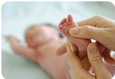
1. pozdĺžne vytieranie chodidla