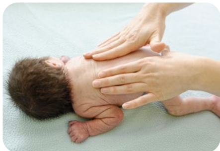
1. roztieranie celými plochami rúk