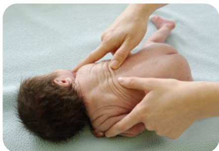
3. krúživé vytieranie chrbtice