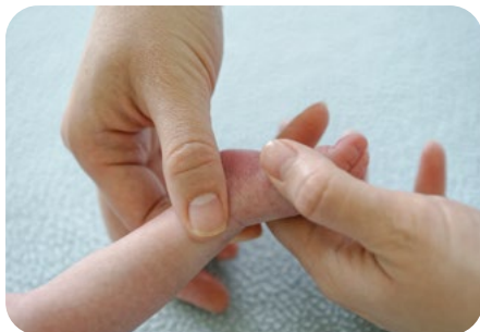
2. bočné vytieranie členka