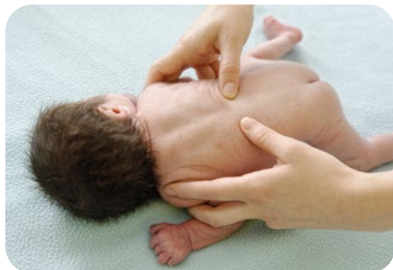
2. vytieranie medzistavcových priestorov