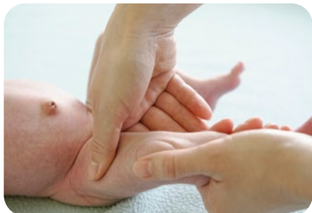
5. vytieranie stehna