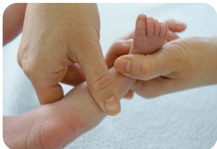
3. vytieranie predkolenia