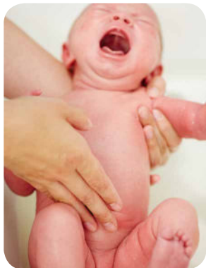
5. Opláchneme oblasť bruška a okolie pupka.