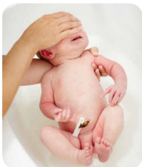
3. Kúpanie začneme jemným umytím tváričky bábäťka.