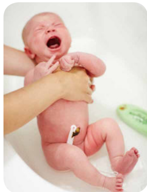
7. Opláchneme ruky a hrudník.