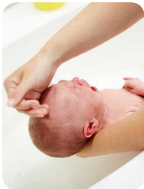
6. Potom opláchneme vlásy, na čo nepotrebujeme šampón.