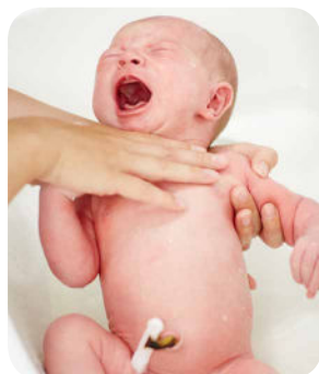
4. Osobitnú pozornosť venujeme umytiu záhybov v oblasti krku.