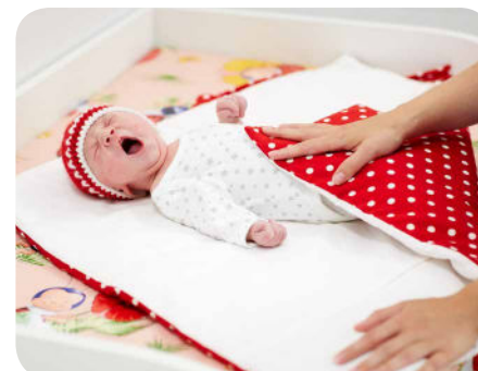
20. Oblečené dieťatko zabalíme do pripravenej čistej perinky.