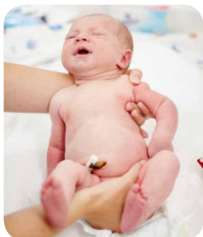
2. Správne uchytiť dieťaťko, aby sa nám nevyšmyklo. Jedna ruka obopína rameno dieťaťa, druhou rukou mamička obopína stehno.