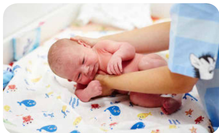
11. Pri ukladaní dieťatka na podložku je dôležité najprv položiť sedaciu časť.