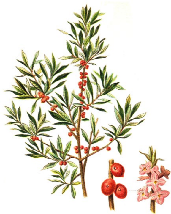
LYKOVEC JEDOVATÝ ( Daphne mezereum )