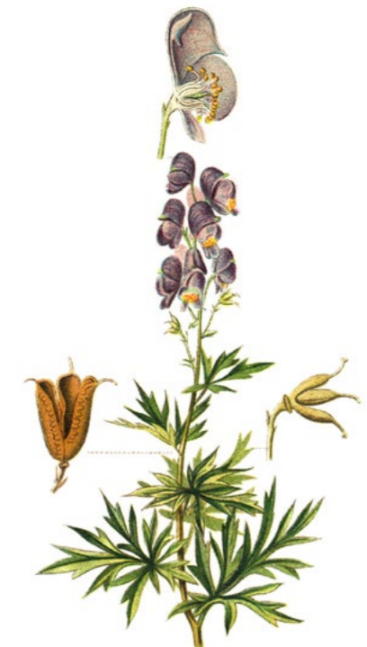
NÁPRSTNÍK ČERVENÝ ( Digitalis purpurea )