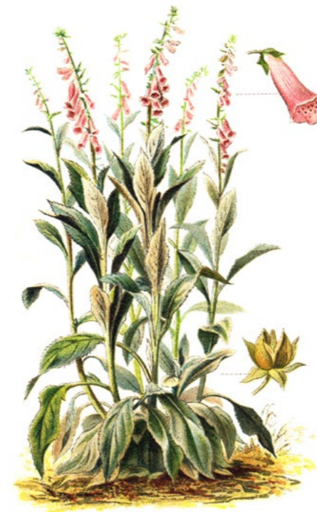
PRILBICA MODRÁ ( Aconitum napellus )