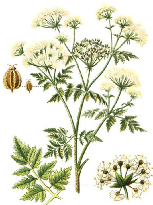
BOLEHLAV ŠKVRNITÝ ( Conium maculatum )