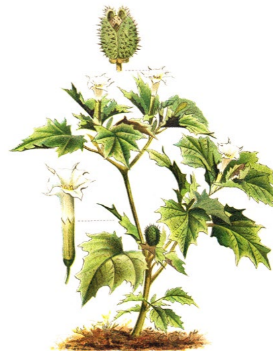
ĽULKOVEC ZLOMOCNÝ ( Atropa belladonna )