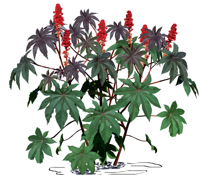
RICÍN OBYČAJNÝ ( Ricinus communis )