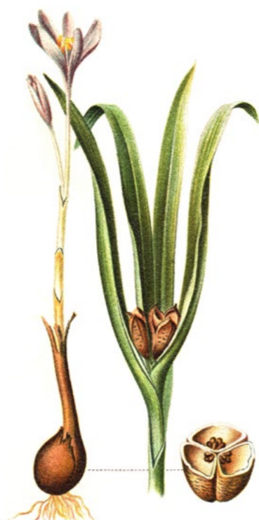
JESIENKA OBYČAJNÁ ( Colchicum autumnale )