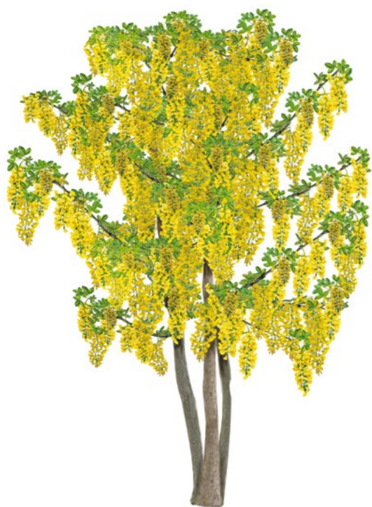
ŠTEDREC OVISNUTÝ ( Laburnum anagyroides )