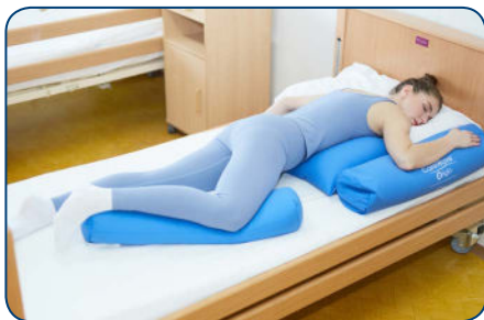
obr. 2 Semipronáčná poloha