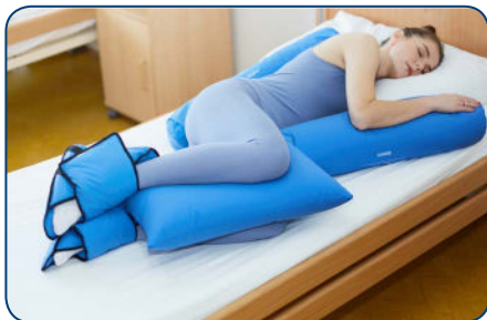
obr. 6 Poloha na boku s 90° uhlom