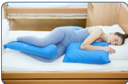
obr. 1 Laterálna poloha