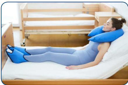
obr. 11 Poloha s vyvýšeným trupom