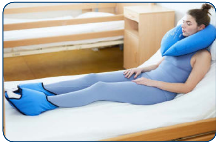
obr. 14 Sedenie chorého v posteli