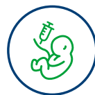
Odber pupočnikovej krvi