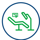
Pôrodné izby novej generácie