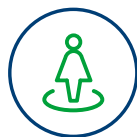
Individuálny pôrodný plán